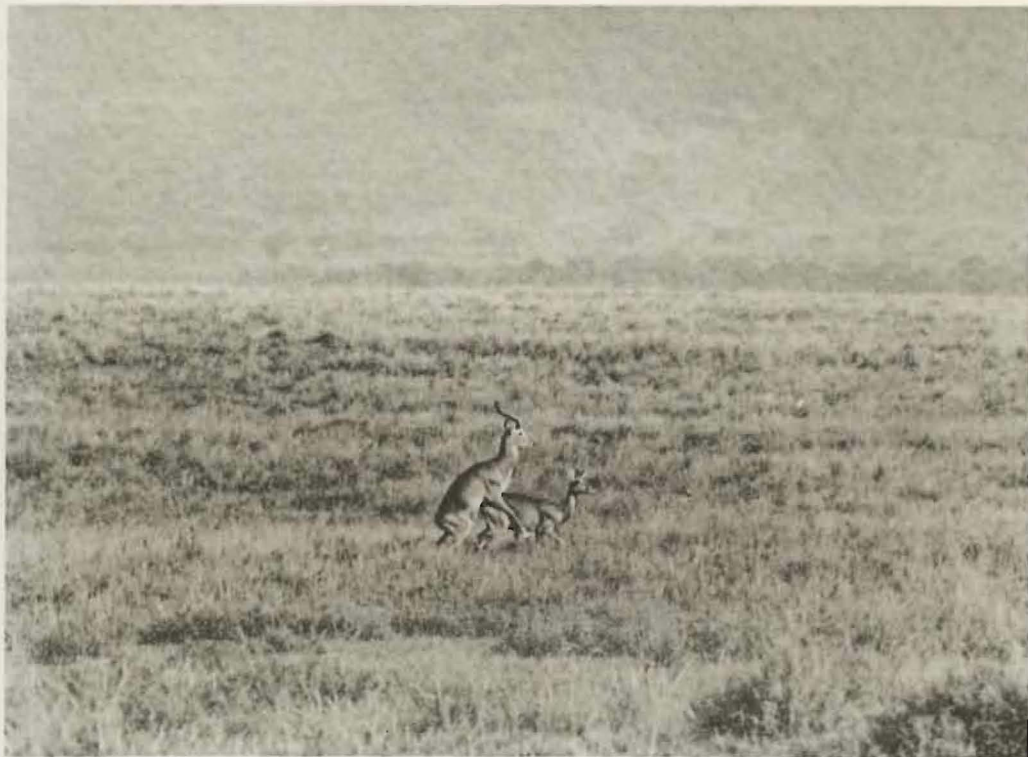
Fig. 1. — Plaine de la Rwindi. Accouplement de Cobs de Buffon ( Adenota kob neumanni ROTSCH.).