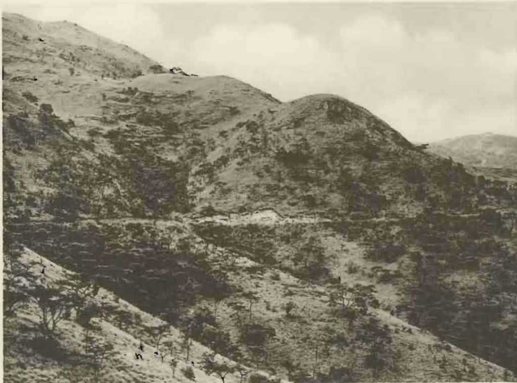
Fig. 24bis. — L'escarpement de Kabasha. Décembre 1934.