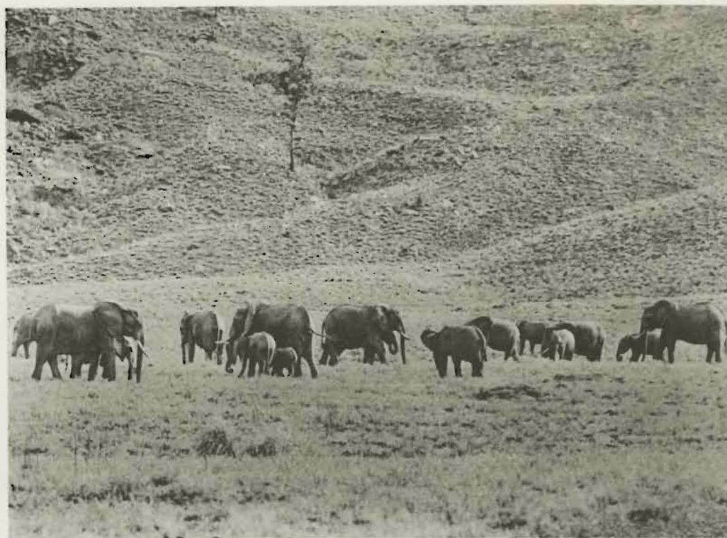
Fig. 26. — Troupeau d'Eléphants dans la partie occidentale de la plaine de la Rwindi.