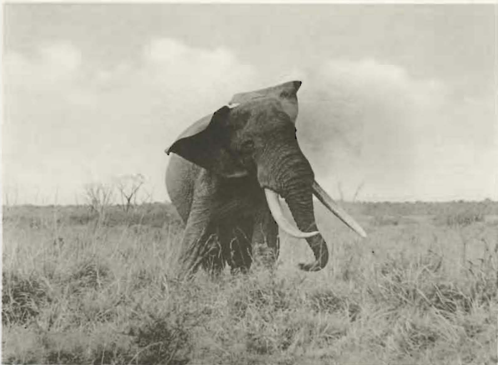
Fig. 32. — Attitude d'un Eléphant s'arrosant de terre.