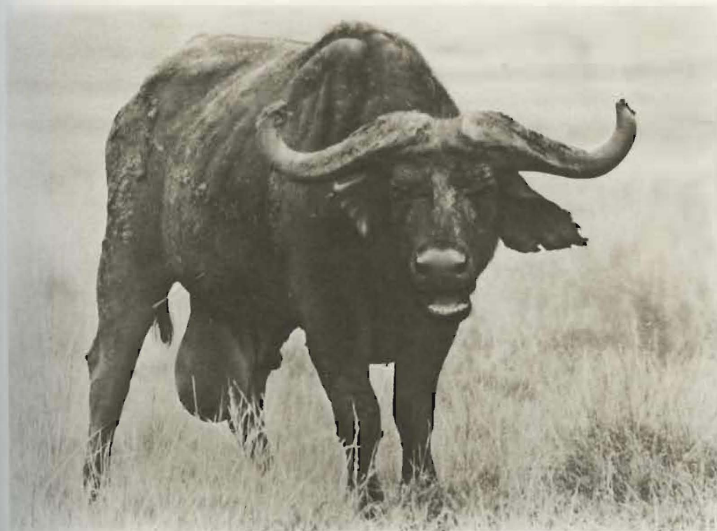
Fig. 56. — Buffle mâle porteur d'une hernie scrotale.