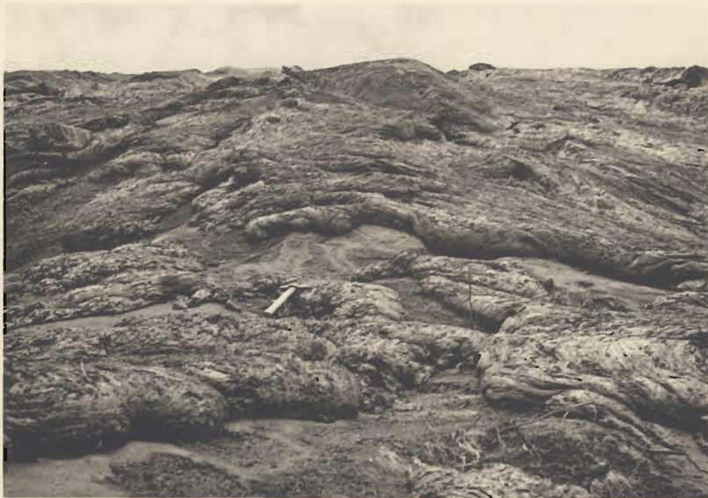
2. Lave auto-propulsive.