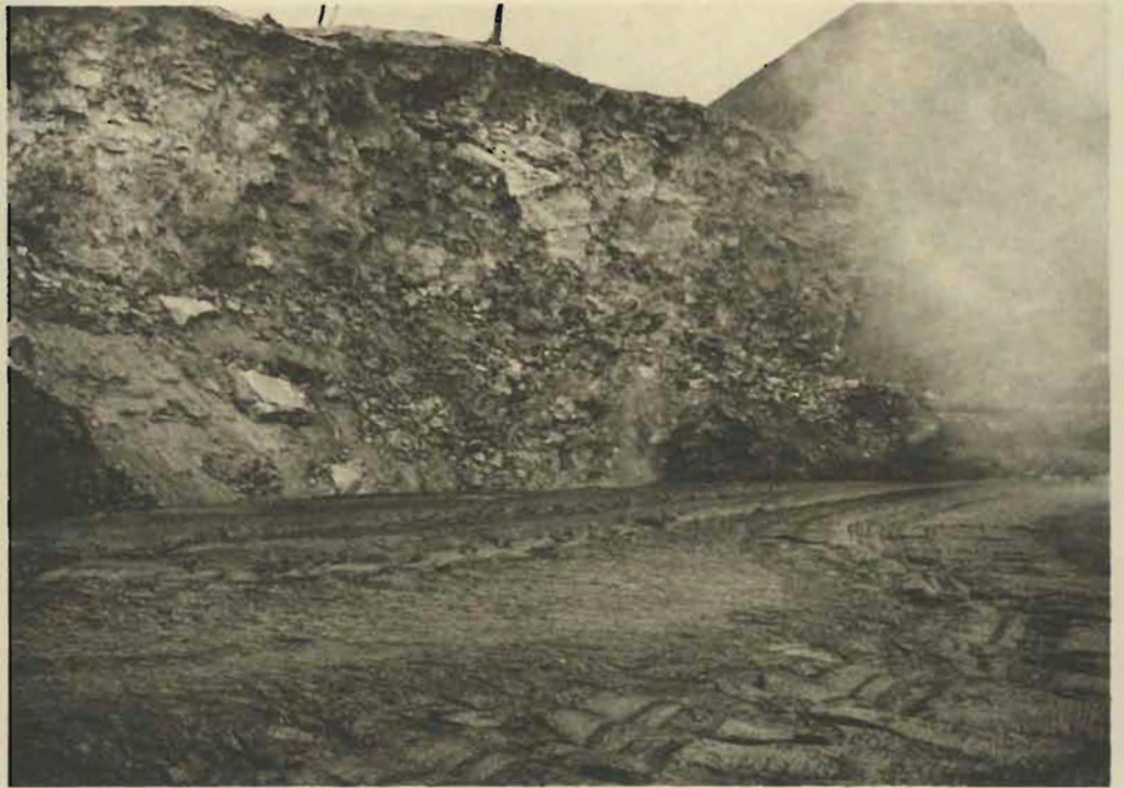
1. Partie sud du lac de lave.