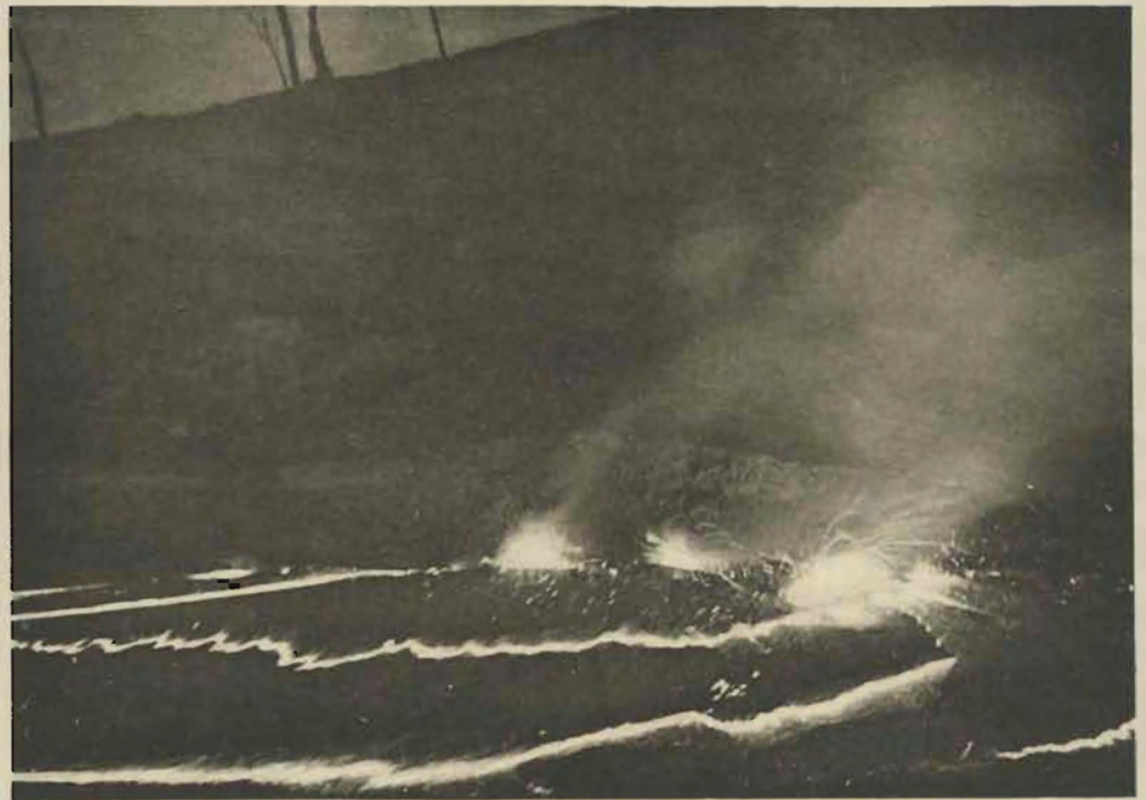
2. Le lac de lave, la nuit.