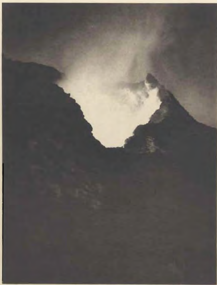
2. Gueulard incandescent.