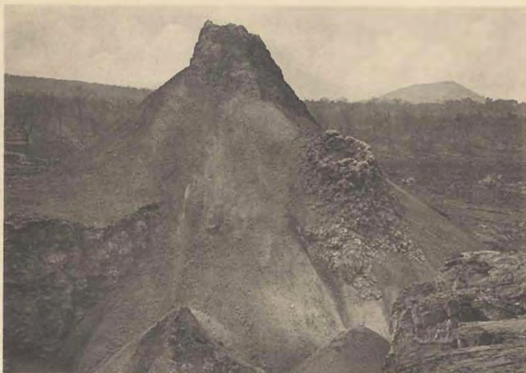
1. Cône 3 et satellite 3' devenus inactifs.