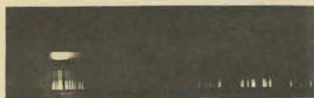
3. Le spectre, orifice 9.