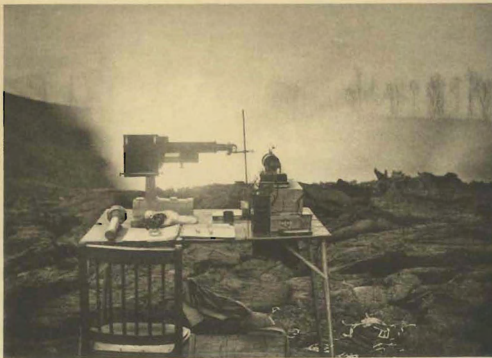
1. Installation du spectrographe.