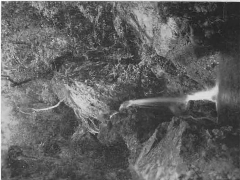
FIG. 2. — Chutes de la rivière Lupiala.