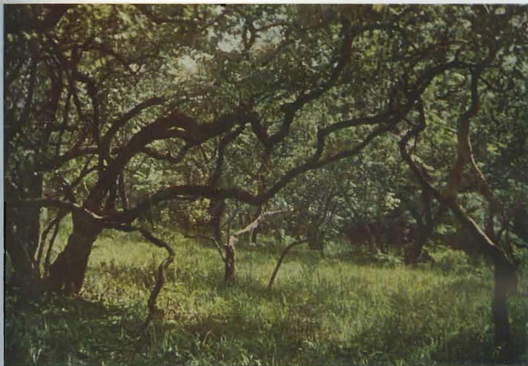
FIG. 2. — Kaswabilenga.