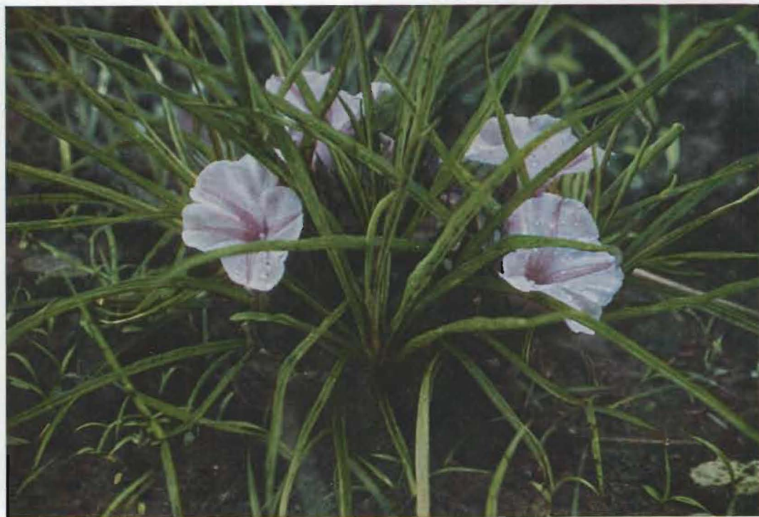
FIG. 2. — Ipomaea Welwitschii ENGLER.