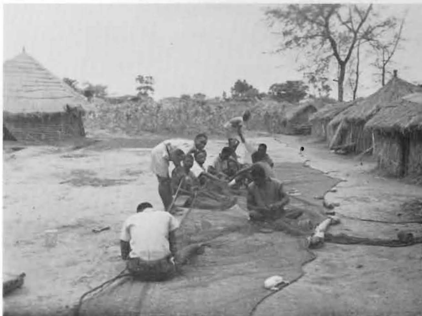
FIG. 1. — Réparation d'un filet de pêche.