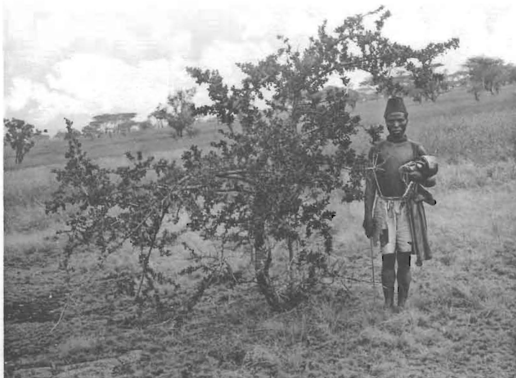
1. Commiphora africana (ARN.) ENGL. dans la savane.