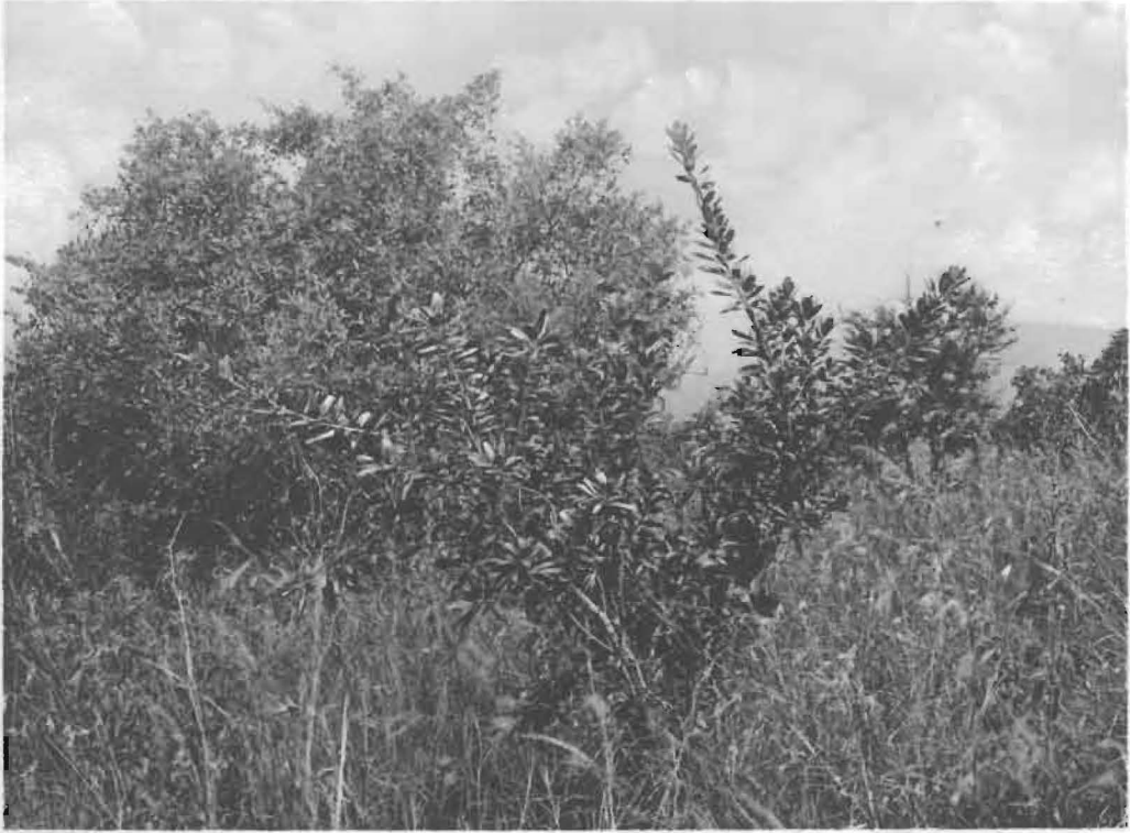
1. Ficus kagerensis LEBRUN et TOUSSAINT dans la savane à Themeda.