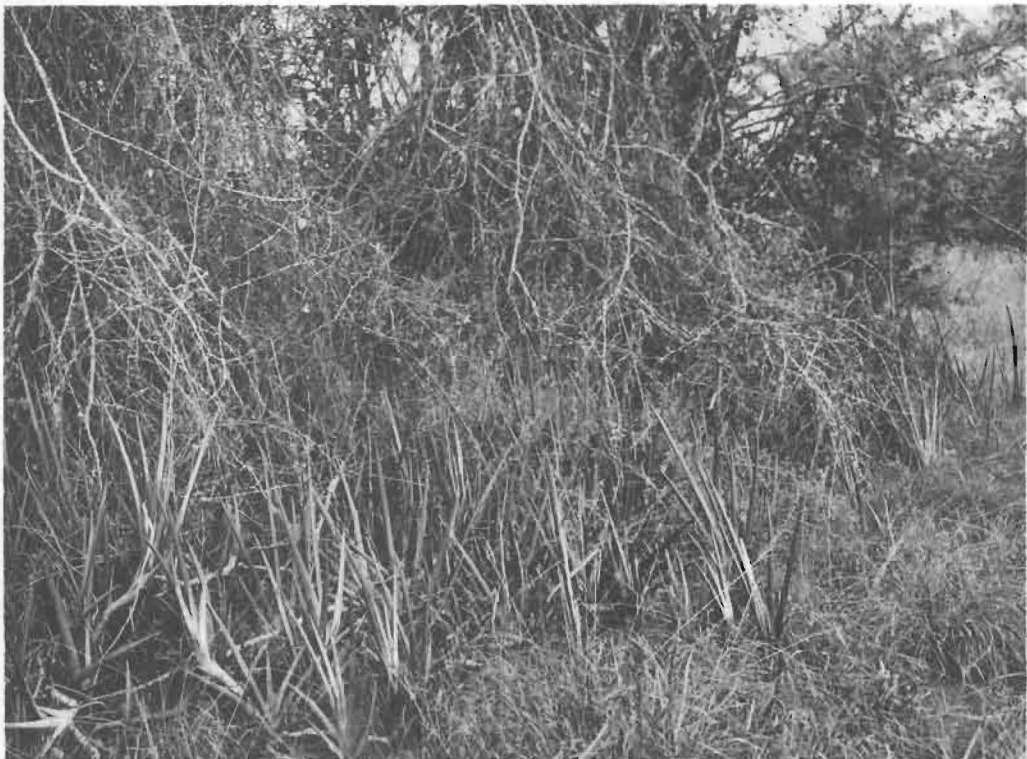
2. Groupe de Sansevieria gracilis N. E. Br. à la lisière d'un bosquet xérophile.