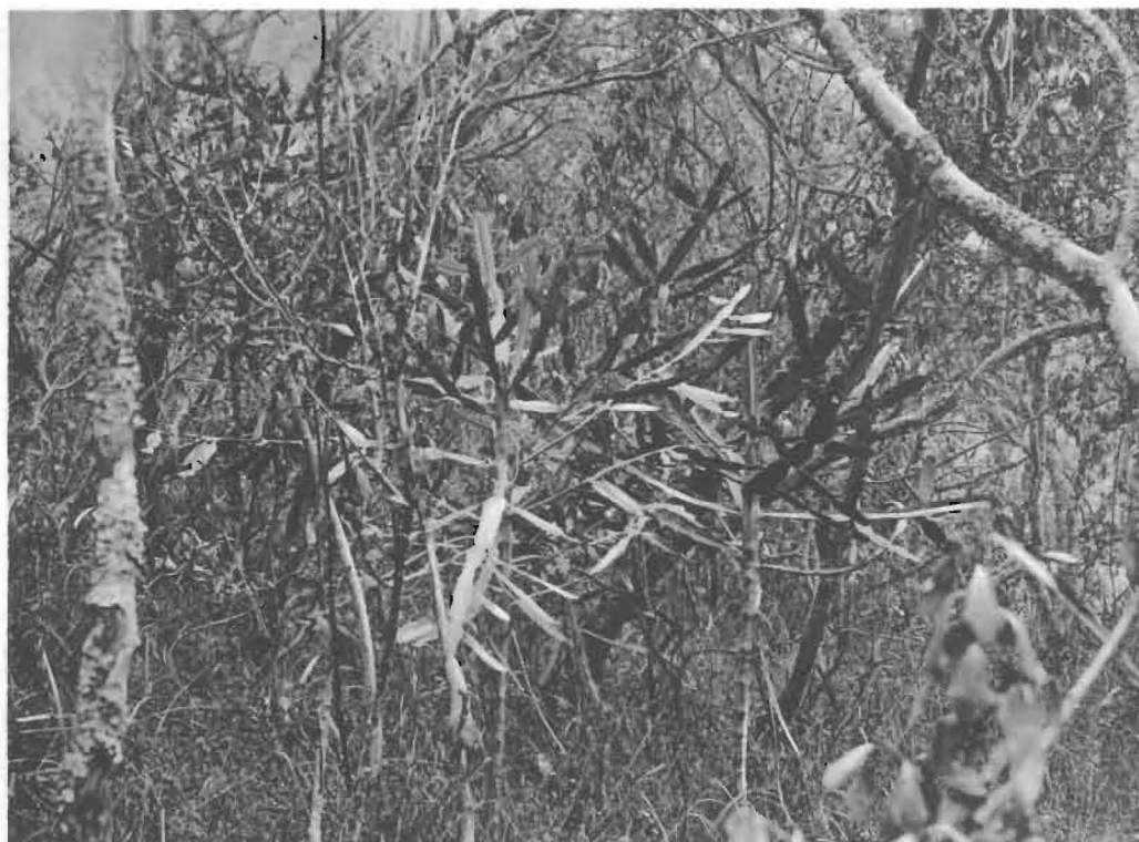
2. Jeune brin d' Euphorbia Dawei N. E. Br. dans le sous-bois de la forêt claire.