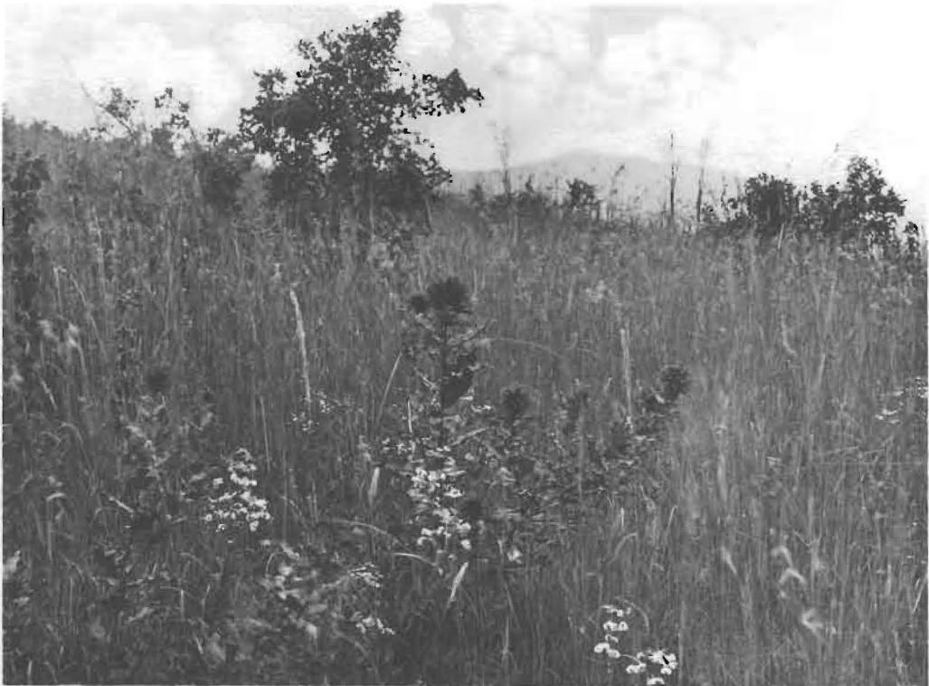
2. Groupe d' Echinops amplexicaulis OLIV. en fleurs dans la savane herbeuse.