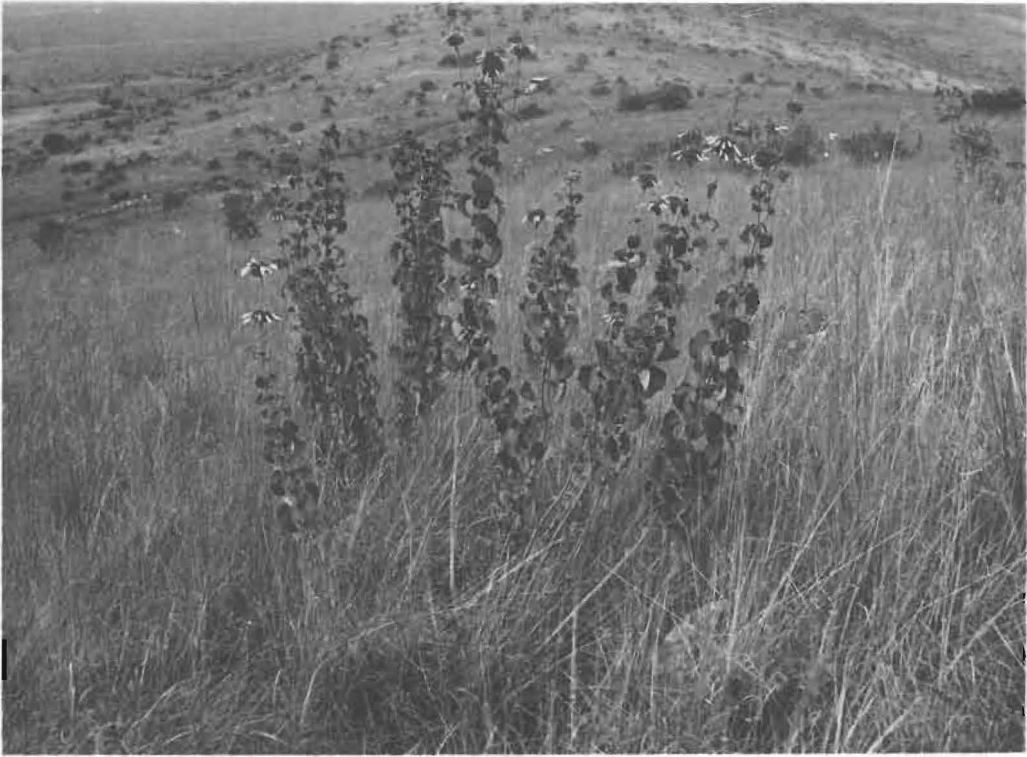
1. Groupe de Leonotis kagerensis LEBRUN et TOUSSAINT dans la savane à Hyparrhenia collina (PILG.) STAPP et Hyparrhenia dissoluta (NEES) C. E. HUBB.