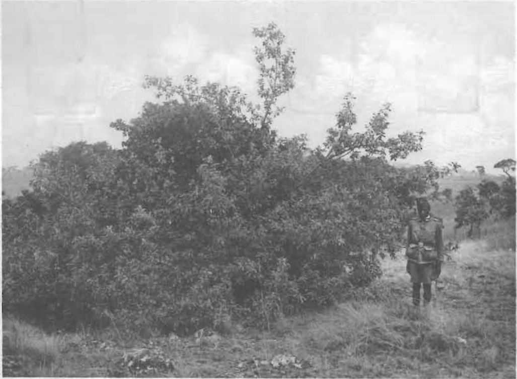
1. Buisson de Lannea fulva ENGL. à la lisière d'un petit boqueteau en formation.