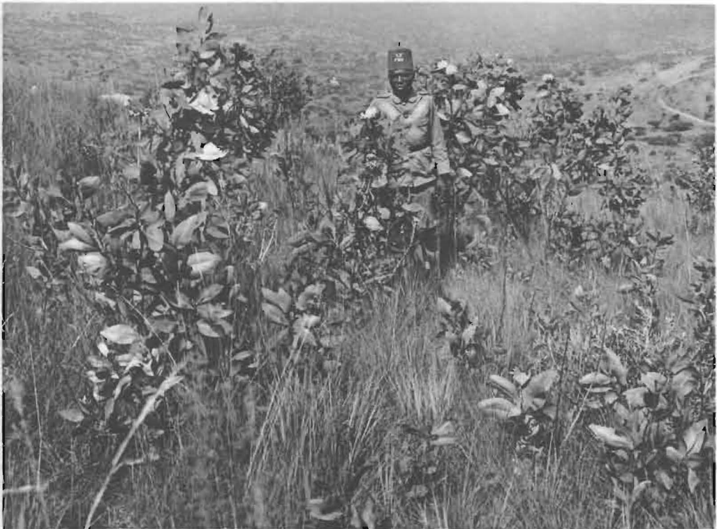
2. Groupe de Protea madiensis OLIV. en fleurs