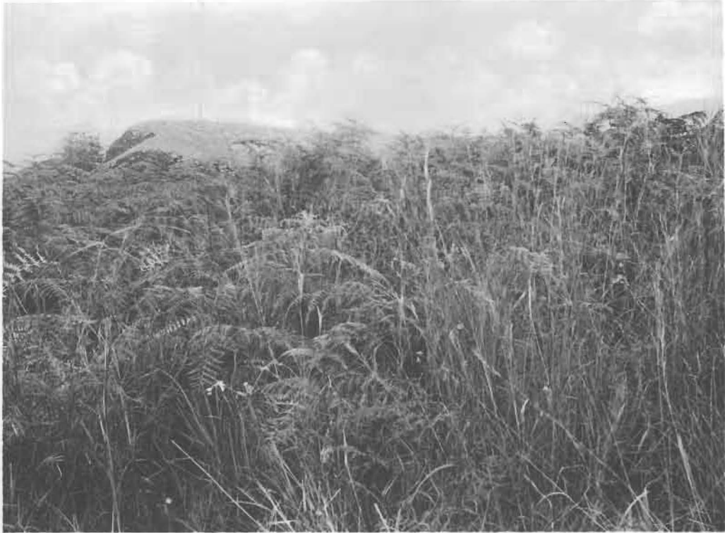
1. Fougeraie à Pteridium aquilinum (L.) KUHN.